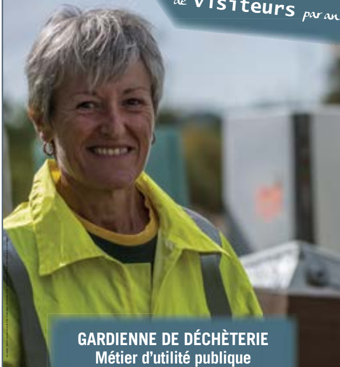
GARDIENNE DE DÉCHÈTERIE Métier d'utilité publique